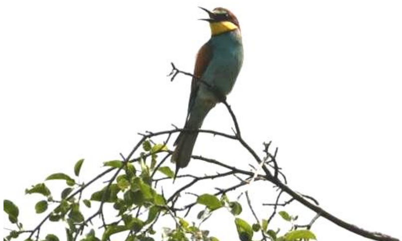
Hledáme milotické opály ☺