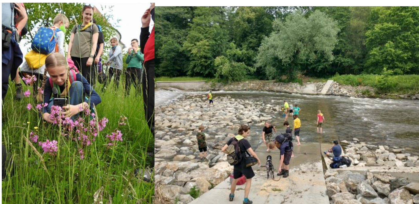
Na výpravě Za bruntálskými sopkami a Za obeliskem