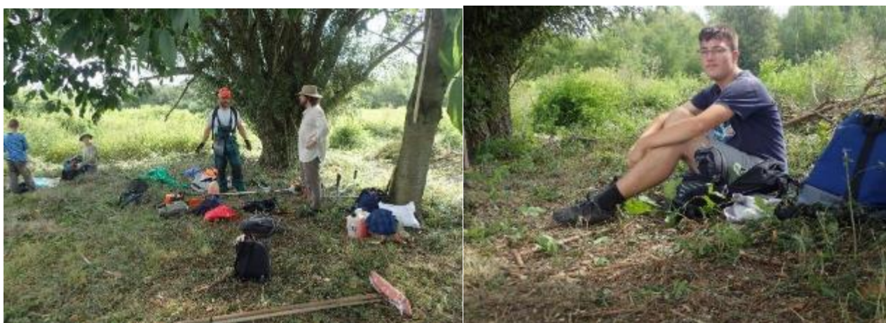
Po práci nás čekal zasloužený oběd a odpočinek.