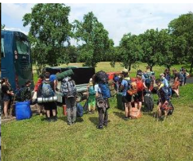
A jsme na místě...