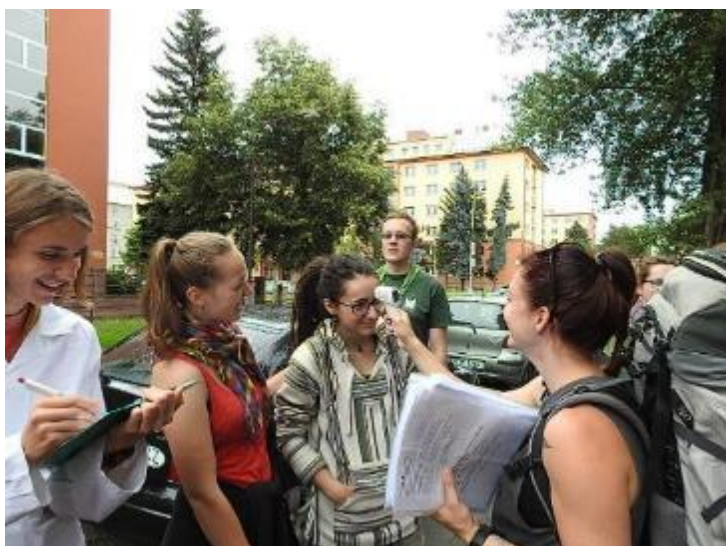
Do Drakonie nemůže nikdo se zvýšenou teplotou.