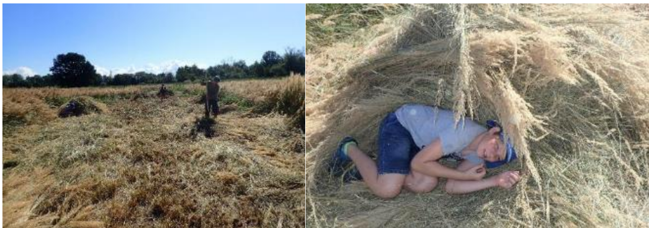
Práce na přímém slunci je úmorná a v rámci přežití jsme v zoufalství vyhledávali i ten nejmenší stín.