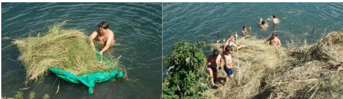
Posekanou třtinu jsme využili na stavbu ostrůvků, na kterých může hnízdit vodní ptactvo.