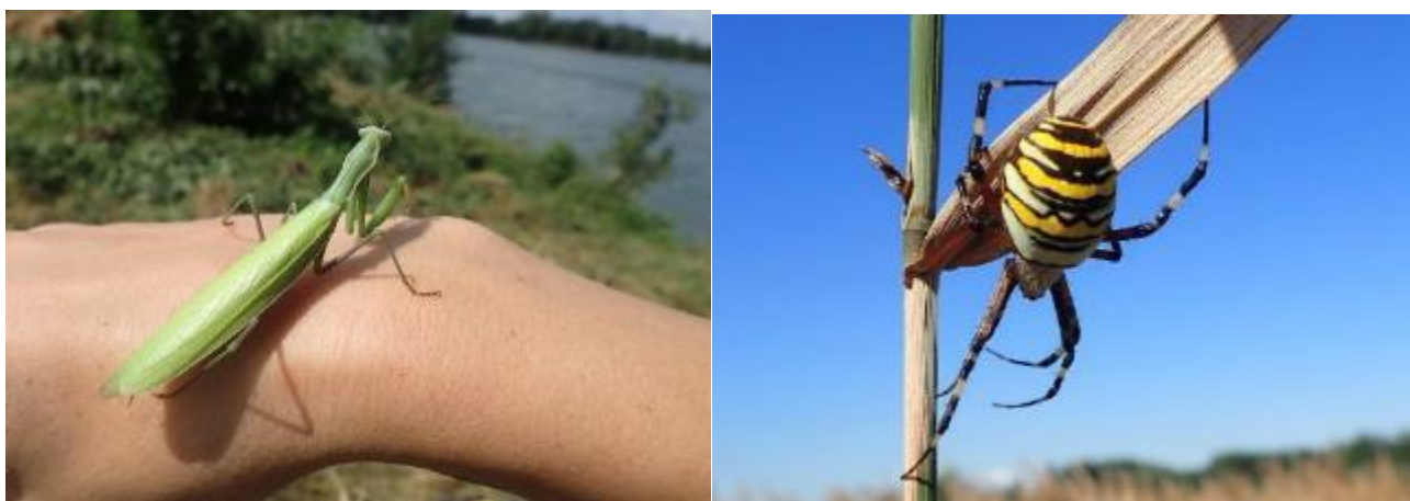
Na ostrově je živo...viděli jsme například kudlanku nábožnou a křižáka pruhovaného.