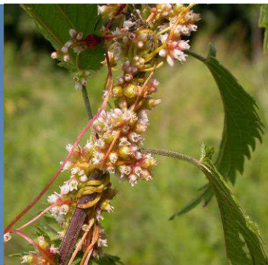
Kokotice povázka Cuscuta europaea

Synantropní druh častý na polích a zahradách. Kvete od března do října, což ho spolu s velkou produkcí semen (až desítky tisíc na jednu rostlinu) řadí mezi úspěšné plevely. Kokoška byla již ve starověku známá jako léčivka ovlivňující, krvácení a krev obecně.