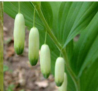
Kokořík vonný Polygonatum odoratum

Parazitická rostlina, která napadá nadzemní části rostlin. Rostlina nemá listy, pouze metr dlouhé načervenalé šlahouny s šupinovitými útvary a drobnými květy. Povázka často parazituje na kopřivách. Taktéž úspěšný plevel, který vyprodukuje