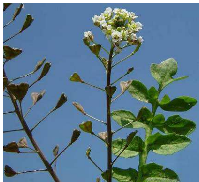
Kokoška pastuší tobolka Capsella bursa-pastoris

Rostlin, jejichž název koktá je nepřeborné množství, kukuřice, lilie, ananas... Ale ryze ukoktané jsem objevila pouze tři. Tady jsou: