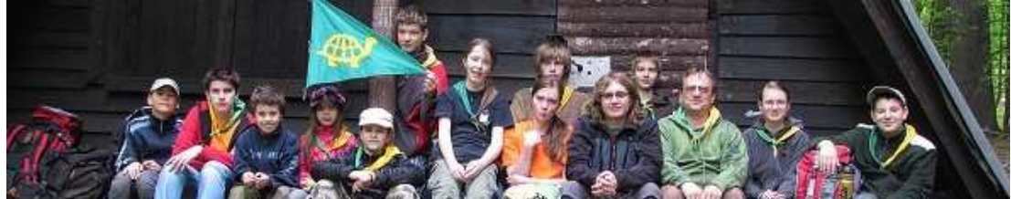
6.-8.5. Áčko - paměti stromů