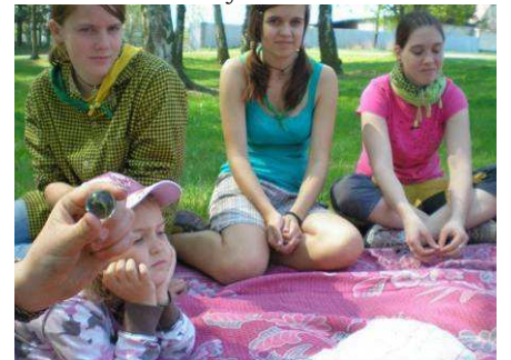
23.4. Velikonoční kuličkobraní