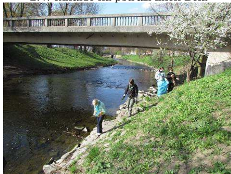
9.4. čištění Bystřice v Olomouci