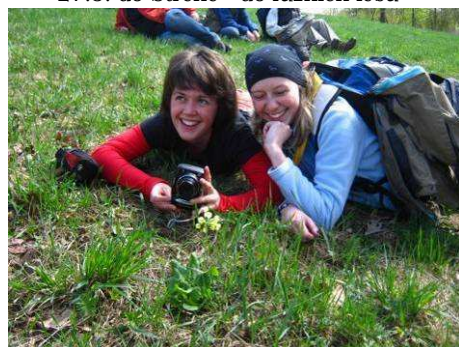
9.4. Hranické putování s Falcem