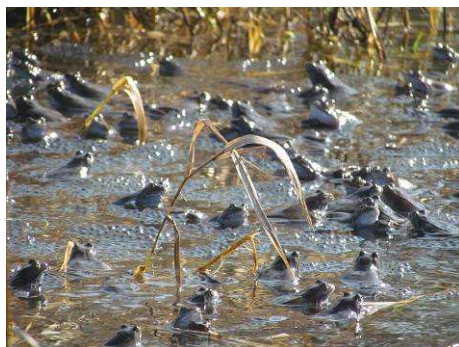
27.3. do Střeneň - do lužních lesů