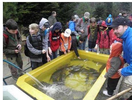
2.4. exkurze na pstruží líheň Bělá