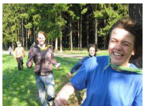
30.4. Čarodějná Kartouzka