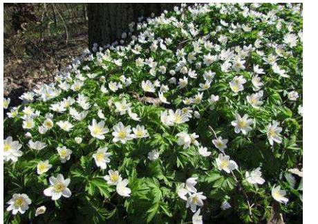
10.4. Terežské údolí