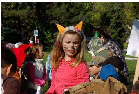
20.4. Den Země pro nejmenší