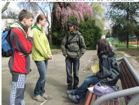
8.4. mk ZS- ZL