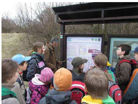
26.3. Vápenice – z Čelechovic do Třebčína