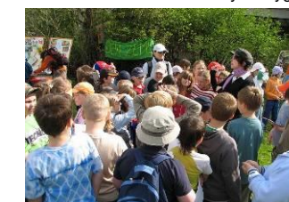
20.4. Den Země pro nejmenší