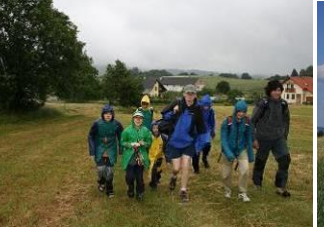
16.6. na dně moří u Chabičova