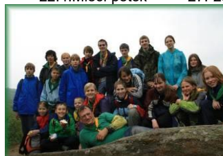
4.-8.5. Podyjí – výprava objevů roku