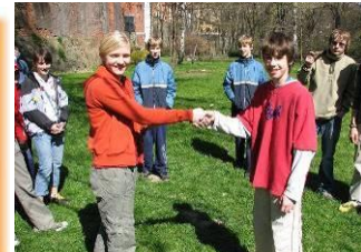
5.4. kmenová kuličkáda a mlákiáda