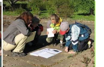
13.4. MK Zelené stezky