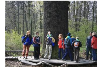
7.4. Království a lomy v Grygově