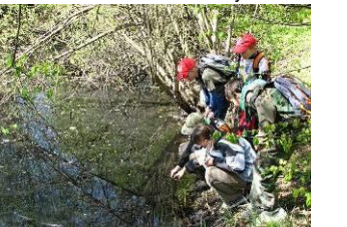
21.4. mokřiny a tůně ve Střeni