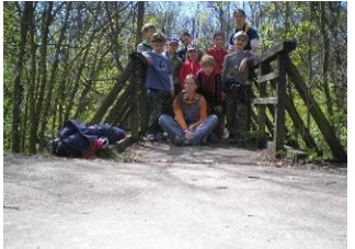
21.4. Z Litovle do Střene