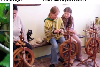
6.5. Valašské Meziříčí