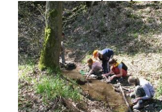
22.4. Mločí potok