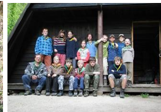
27.-29.4. Kávíčka pro Bukeše Mešouta – Hoštejn