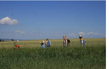
17.6. Na skále u Hněvotína