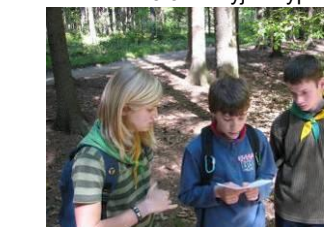
12.5. krajské kolo Zelené stezky