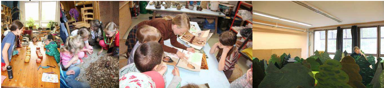
Den Země pro nejmenší

Během roku DDM Olomouc a náš oddíl připravily a zajistily pro malé děti dvě přírodou motivované akce: Den Země pro nejmenší a Pěnkava Katka na podzim. Celkem přišlo asi 450 návštěvníků.