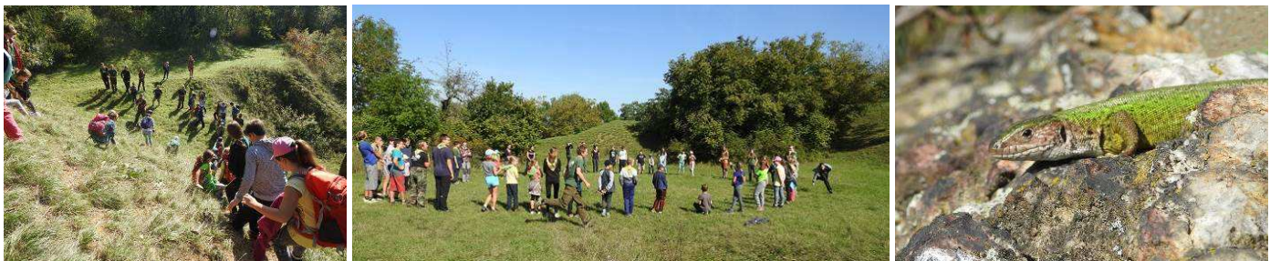
Cestu do Východních věží, Khaz Drakk Duru a Drakonie jsme zahájili ve Strejčkově lomu.