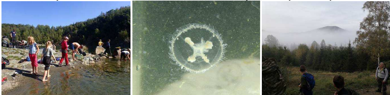
Za medůzkami ve Výklekách.