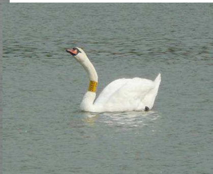
... 2.5.2010 tamtéž...