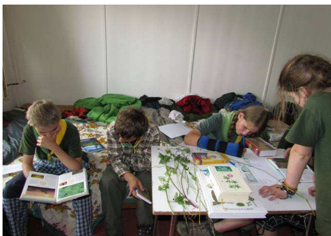
Ó, ptáci zrovna trošku něčeho jiného než opeřenců

Při našem pobytu v Jizerských horách jsme objevili louku, jenž byla zajímavá z entomologického i botanického hlediska, pro nás však především z hlediska ornitologického. Hned první den jsme v noci slyšeli krásné „rép rép“ chřástala polního. Po bližším prozkoumání lokality jsme viděli skřivany, strnady, bramborničky hnědé, pěnice a křepelky. Z louky byl také krásný výhled, který nám k naší radosti zastínil luňák červený nebo čáp bílý. Na okraji lesů se ozývali pěnkavy, králíčci, budníčci nebo také bubnování strakapoudů a datla černého. V noci se také z okolních lesů nechal slyšet pušтік obecný. Na louku jsme se několikrát vrátili a poslouchali chřástala. Stačí si lehnout do trávy a zaposlouchat se do chřástalí melodie.