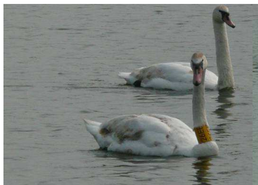
26EE 26.4.2008 v Tovačově...

Je to už pár let zpátky, co jsem poprvé navštívila exkurzi MOS. Tenkrát, 26.4.2008, jsme v hejniku labutí pozorovali i jednu v 1. roce života, kterou na první pohled od ostatních odlišovala žlutá „roura“ na krku. Byla to Polka se žlutým krčním límcem 26EE. Následující rok se přesunula na jižní Moravu a já jsem na ni nějak zapoměla. O to větší překvapení bylo, když 2.5. loňského roku jsem se s ní v Tovačově na tom samém místě znovu setkala. Za ty dva roky, co jsme se viděli naposled z ní už vyrostl pěkný dospělec, který hrdě proplouval mezi ostatními. Teď jsem se s labuťkou AS 5941 potkala znovu, tam, kde jsem to vůbec nečekala. Není to tak dávno, co jsem vyrazila na rodinnou dovolenou do Piešťan. Když jsem se procházela po kolonádě a zableskl se mi mezi bílými labutími těli žlutý plast, zatajil se mi dech. Šesta dvacítká. A opravdu. Mezi ostatními se o naházené pečivo rvala i má stará známá, labuť se žlutým krčním límcem 26EE. To bylo radosti! (Spíše teda z mé strany, ona si na mě zřejmě asi nepamatovala. A i kdyby- co by ze mě měla?) Každopádně, bylo to pro mě víc než nečekané. Kdo ví, kdy a kde se s ní uvidím zase příště. Zda v Tovačově či na Slovensku. A jestli se ještě vůbec uvidíme.