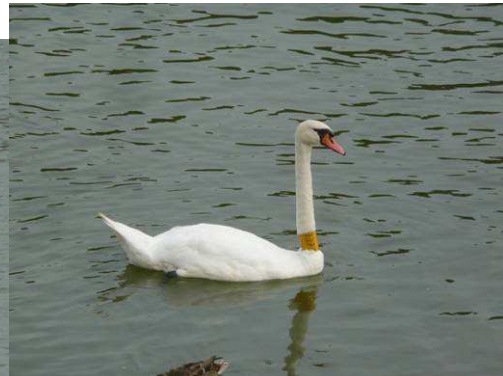
...a 16.8.2011 v Piešťanech na Slovensku