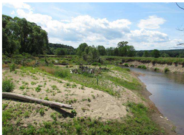
„břehulí řeka“ Smědá