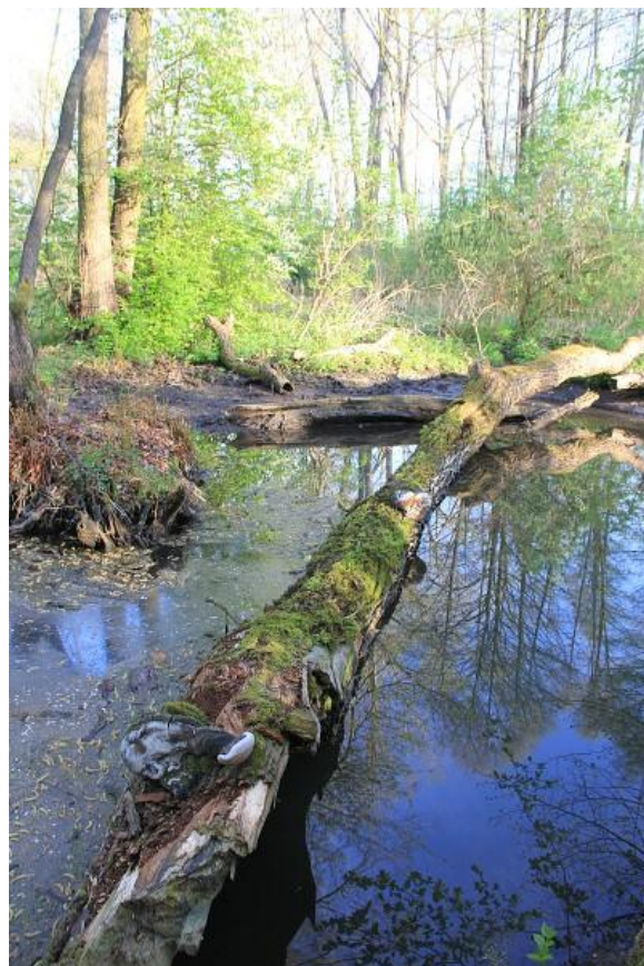
Biotop jedné z částí tras Vítání →