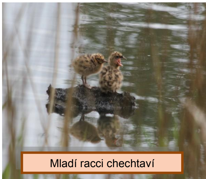
Mladí raci chechtaví

můžeme pozorovat kopřivku anebo pisily čáponohé, které se tu prochází ve vodě na svých dlouhých nohách. A o kus dál vidíme ty kolpíky. Jsou to krásní bílí ptáci, z dálky trochu připomínající čápy. Ovšem zobák mají oble zakončen. Než nám přijede autobus, máme ještě chvíli čas, tak se jdeme podívat k dalšímu menšímu blízkému rybníku, kde se opět ve vodě prochází pisily, kulík a taky další bahňák, kterého jsme nakonec určili jako vodouše hnědého. Večer, po vysprchování a po večeri, si jdeme opět zahrát do tělocvičny hry a pak spát.