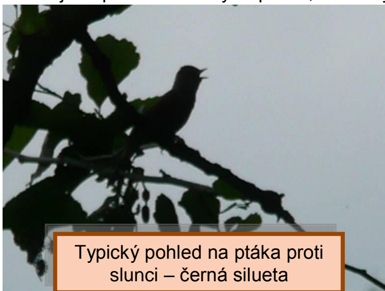
Typický pohled na ptáka proti slunci – černá silueta